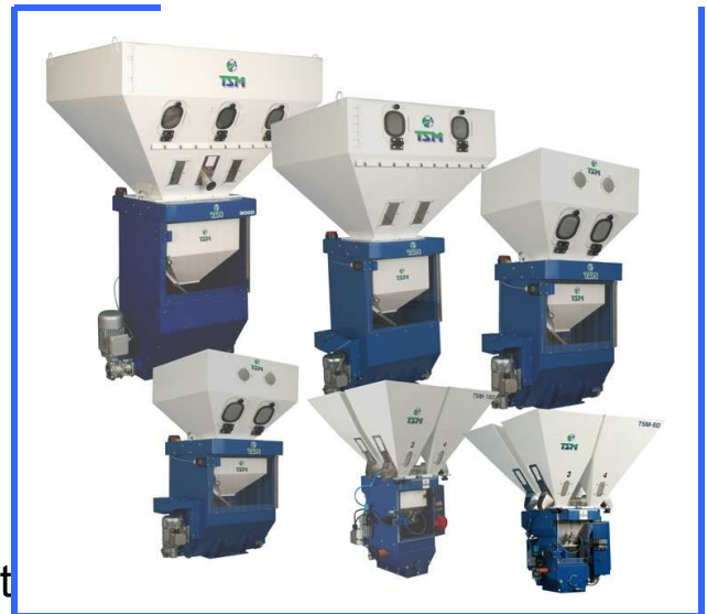
Die SigmaBatch™ Typen

Die TSM SigmaBatch™ Gerätetypen sind kompakt mit einer geringen Bauhöhe. Sie sind unempfindlich konstruiert , bestehen größtenteils aus Stahlguss um den meisten Anforderungen im Betrieb gerecht zu werden. Die Wiegezelle ist Überlastgesichert und vor Beschädigung geschützt.